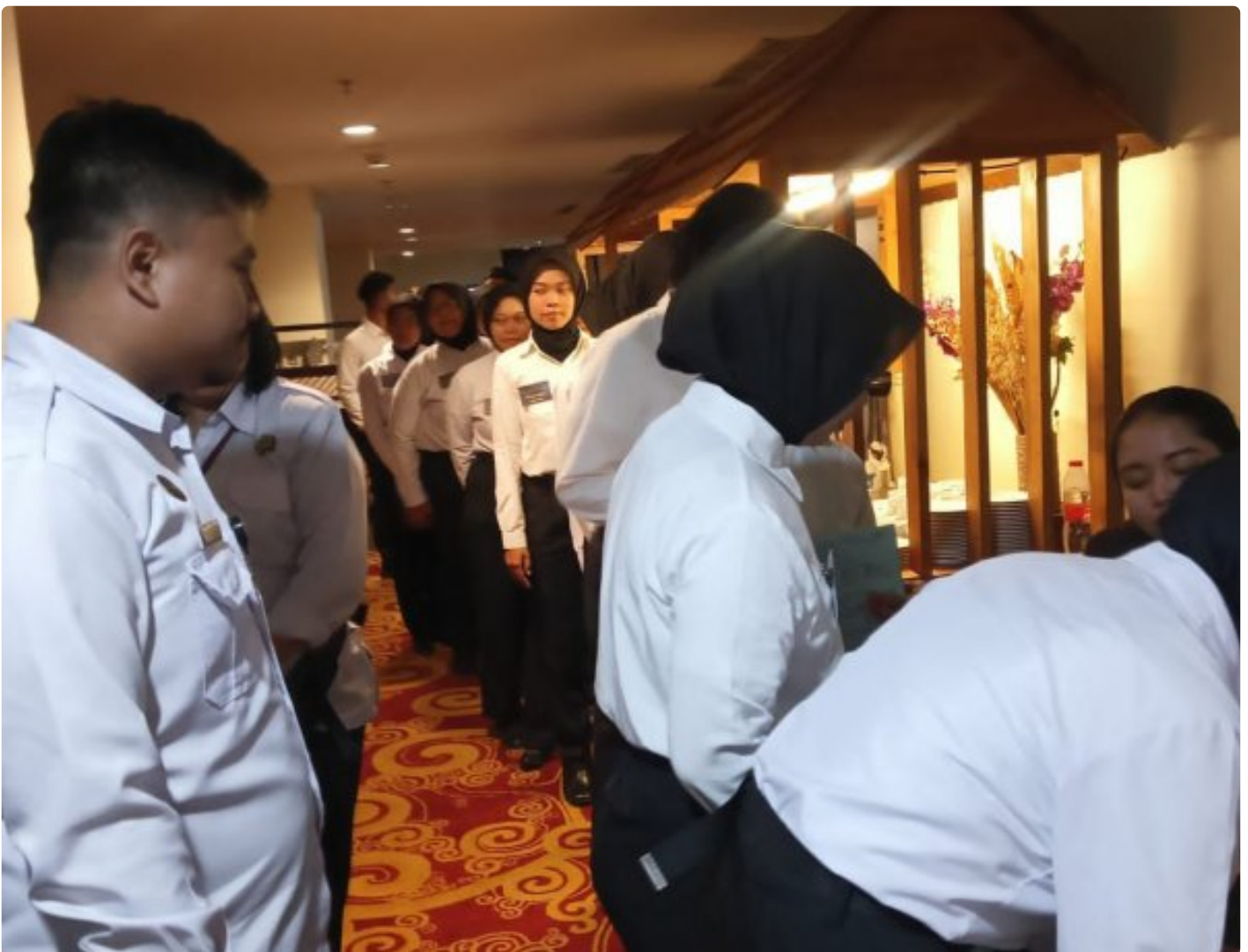
Wujud Kepedulian, Lapas Magelang Ikut Sukseskan Donor Darah HUT Ke-13 Hotel Atria

Magelang - Dalam rangka memperingati Hari Ulang Tahun Ke-13 Hotel Atria Magelang, jajaran Lembaga Pemasyarakatan (Lapas) Magelang turut ambil bagian dalam kegiatan donor darah yang digelar, pada Selasa (02/12/2025).