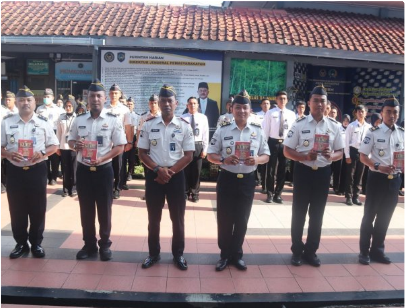
Tingkatkan Profesionalisme Pegawai, Kalapas Magelang bagikan KUHP Baru

Magelang – Dalam upaya meningkatkan profesionalisme serta pemahaman hukum bagi jajaran pegawai, Kepala Lembaga Pemasyarakatan (Lapas) Kelas IIA Magelang membagikan Kitab Undang-Undang Hukum Pidana (KUHP) Baru kepada pegawai Lapas Magelang. Kegiatan tersebut dilaksanakan pada Senin (19/01/2026).