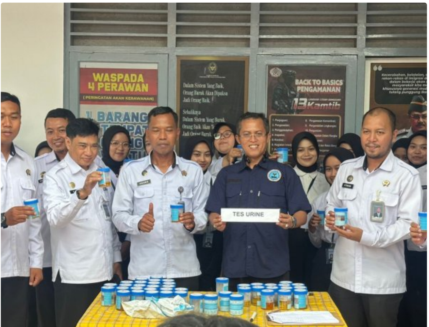
Tes urine kepada Kalapas beserta seluruh pegawai disaksikan oleh Ka.BNN Kabupaten Magelang

Magelang — Lembaga Pemasyarakatan Kelas IIA Magelang menggelar tes urine mendadak kepada Kepala Lapas beserta seluruh pegawai pada Kamis 11/12/2025.