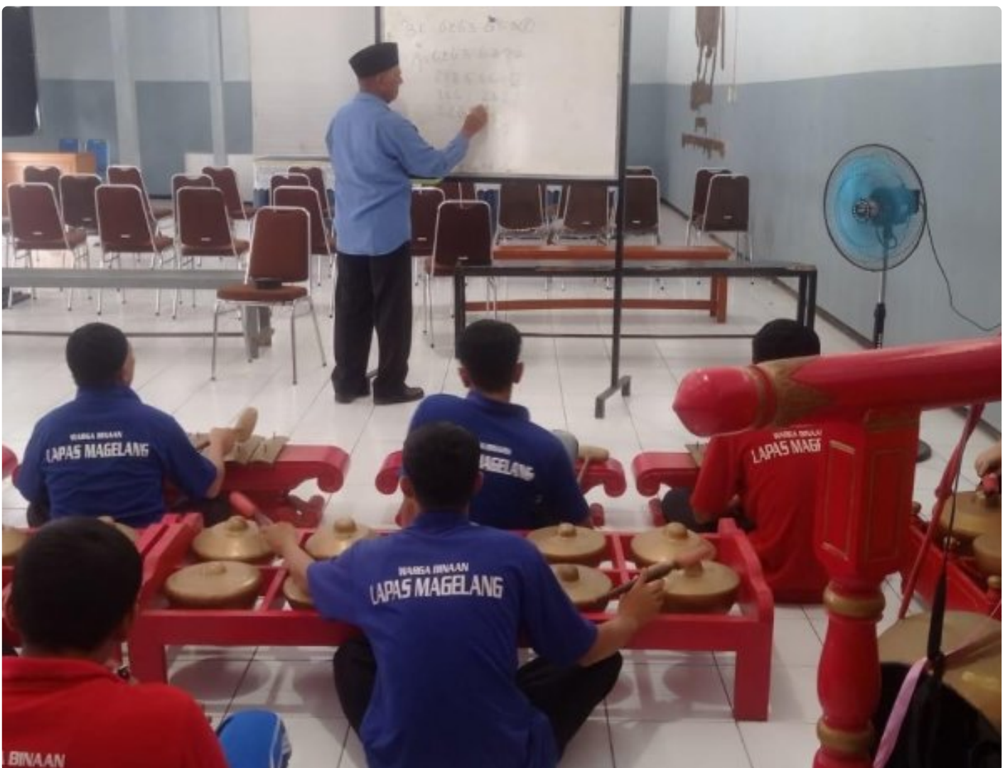
Rangkaian Irama, Rangkaian harapan, WBP Lapas Magelang Latihan Gamelan dengan Penuh Semangat

Magelang - Suara kendang, gong, dan saron terdengar berpadu harmonis dari salah satu sudut Lapas Magelang, di ruang pembinaan sejumlah warga binaan tampak serius mengikuti latihan gamelan yang digelar rutin setiap pekan. Dengan panduan instruktur, mereka menabuh setiap instrumen dengan penuh