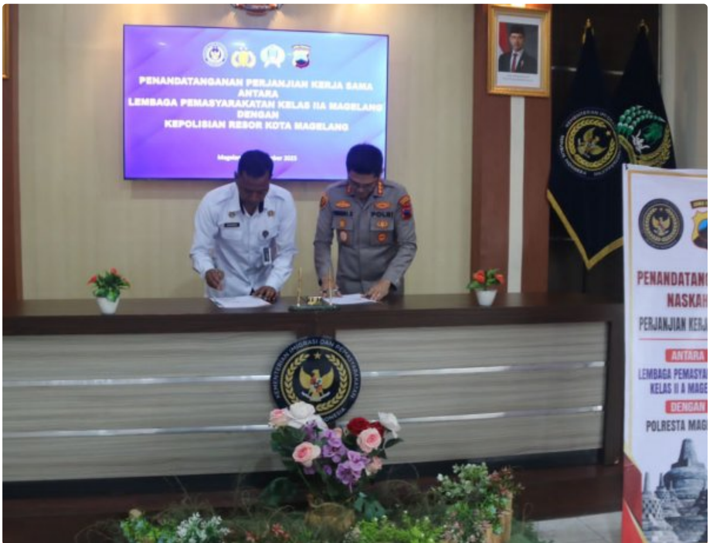
Perkuat Sinergi Antar Aparat, Kalapas dan Kapolresta Magelang Tandatangani PKS

Magelang - Kepala Lembaga Pemasyarakatan (Kalapas) Magelang bersama Kapolresta Magelang secara resmi menandatangani Perjanjian Kerja Sama (PKS) sebagai bentuk penguatan sinergi antar aparat penegak hukum, Kamis 18/12/2025 di Aula Sahardjo Lapas Magelang.