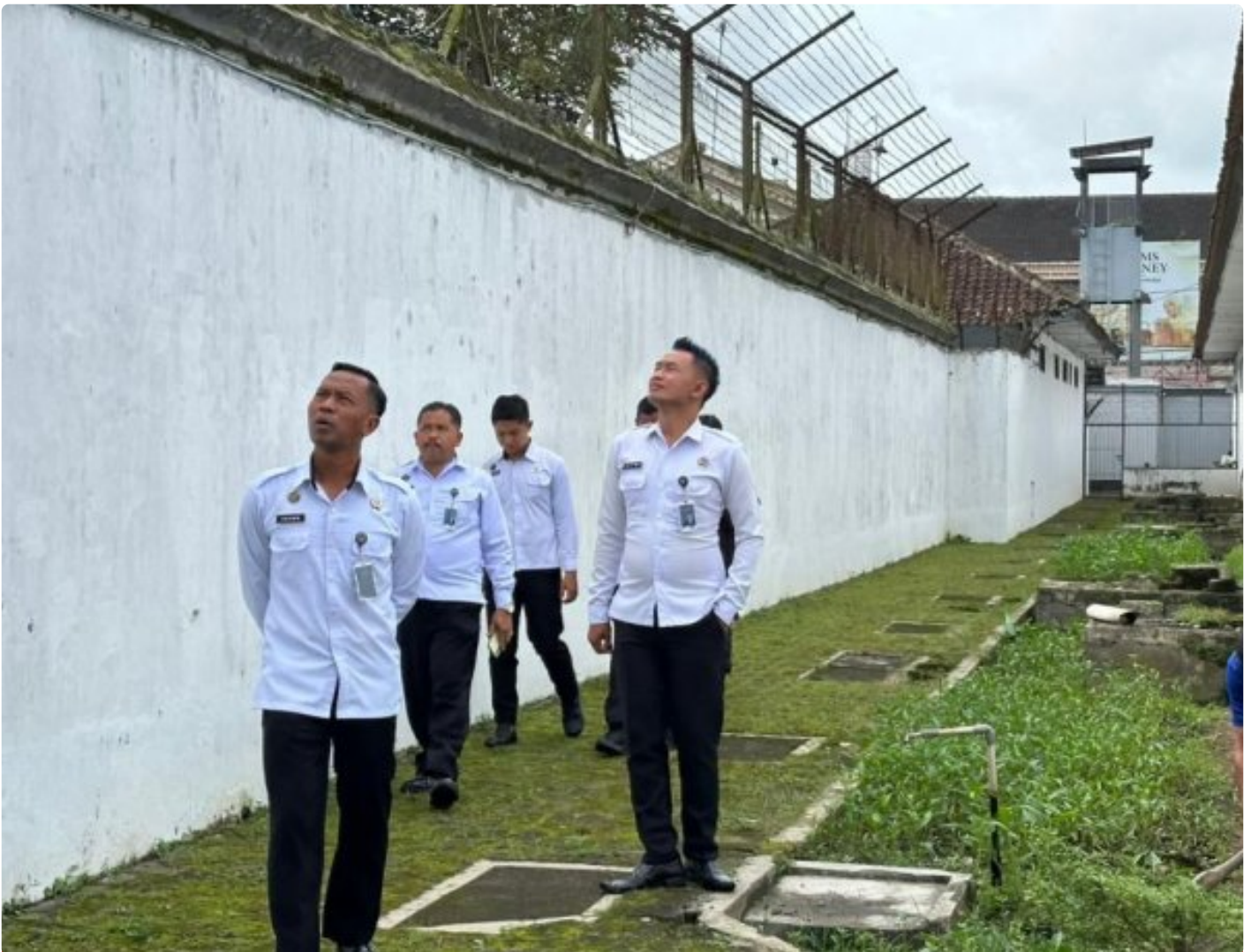
Penguatan Pengamanan, Kalapas Magelang Kontrol Infrastruktur Tembok Keliling dan Pos Atas

Magelang — Dalam rangka memperkuat sistem pengamanan internal, Kepala Lembaga Pemasyarakatan (Kalapas) Magelang melakukan kontrol langsung terhadap infrastruktur keamanan, khususnya pada area tembok keliling dan pos atas, Rabu 10/12/2025.