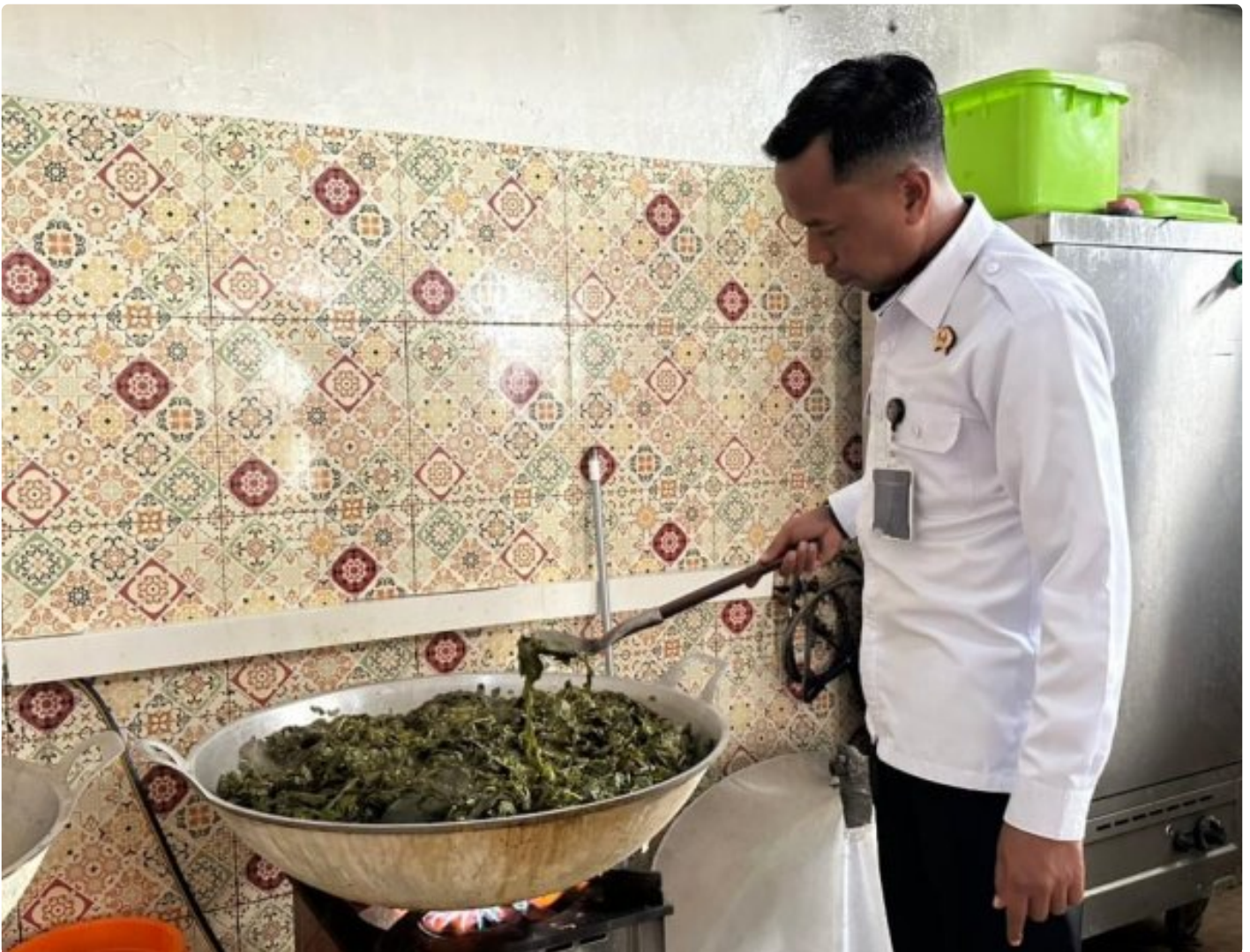
Pastikan Gizi dan Kebersihan Terjaga, Kalapas Magelang Lakukan Pemeriksaan Dapur Lapas

Magelang - Kalapas Magelang melakukan pemeriksaan langsung ke dapur Lapas sebagai bentuk pengawasan rutin untuk memastikan kualitas makanan yang disajikan kepada warga binaan Selasa 09/12/2025.