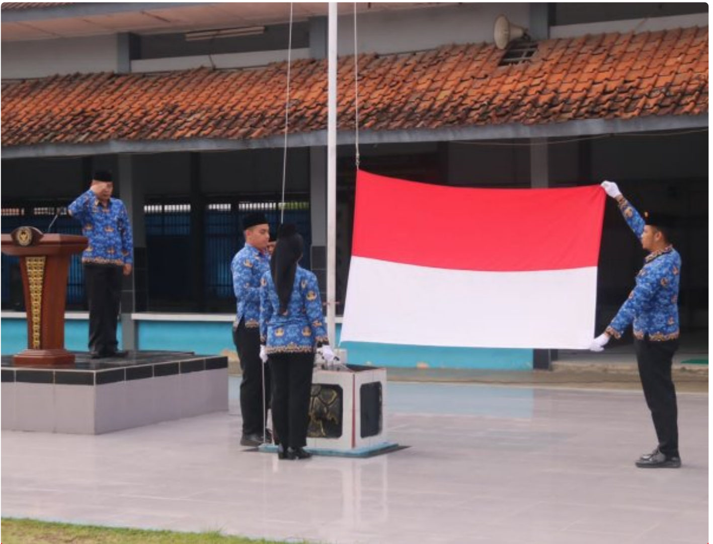
Lapas Magelang Semarakan HUT Korpri ke-54 dengan Upacara Penuh Integritas

Magelang — Lembaga Pemasyarakatan (Lapas) Kelas IIA Magelang menyemarakkan peringatan Hari Ulang Tahun Korps Pegawai Republik Indonesia (HUT Korpri) ke-54 dengan menggelar upacara penuh integritas, pada Senin (01/12/2025).