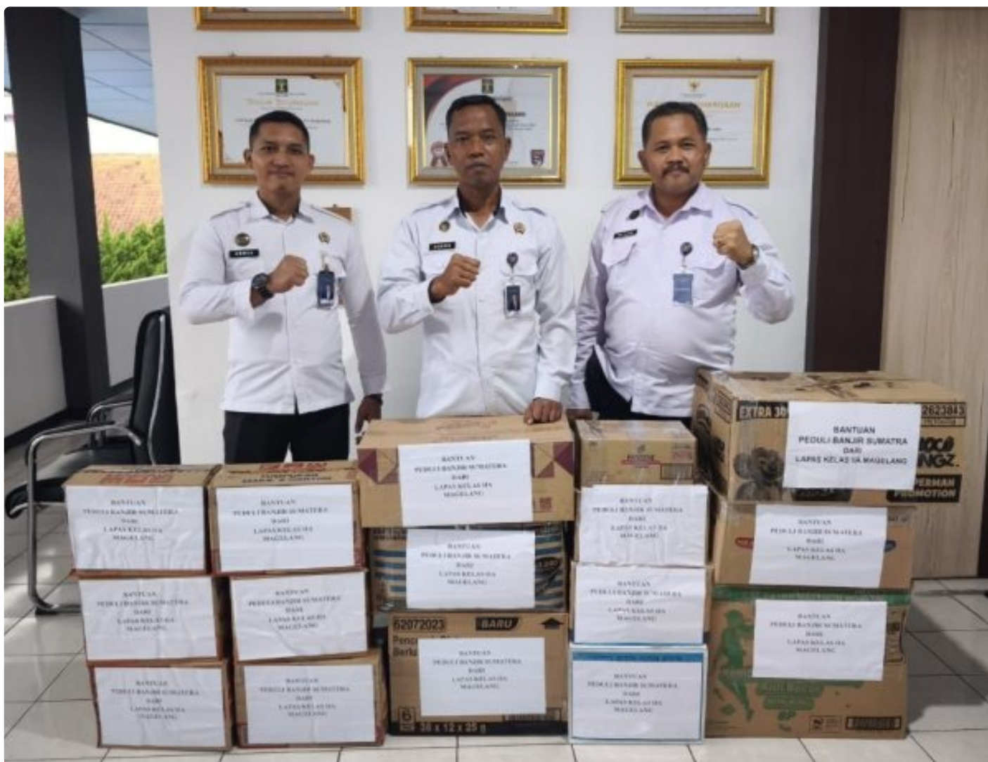
Lapas Magelang Salurkan Bantuan Logistik untuk Korban Banjir Sumatera Barat

Magelang - Lembaga Pemasyarakatan (Lapas) Kelas IIA Magelang menunjukkan kepedulian terhadap para korban banjir yang melanda wilayah Sumatera Barat dengan menyalurkan bantuan logistik pada Kamis 11/12/2025.