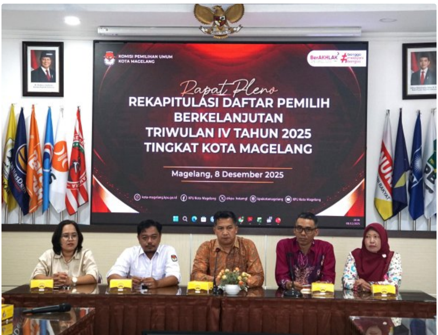
Lapas Magelang hadir Pleno Rekapitulasi Daftar Pemilih Berkelanjutan di KPU Kota Magelang

Magelang - Lembaga Pemasyarakatan (Lapas) Kelas IIA Magelang menghadiri sidang pleno rekapitulasi Daftar Pemilih Berkelanjutan (DPB) Triwulan IV Tahun 2025 yang digelar oleh Komisi Pemilihan Umum (KPU) Kota Magelang. Senin (08/12/2025).Lapas Magelang diwakili oleh Kasubsi Registrasi, yang hadir untuk