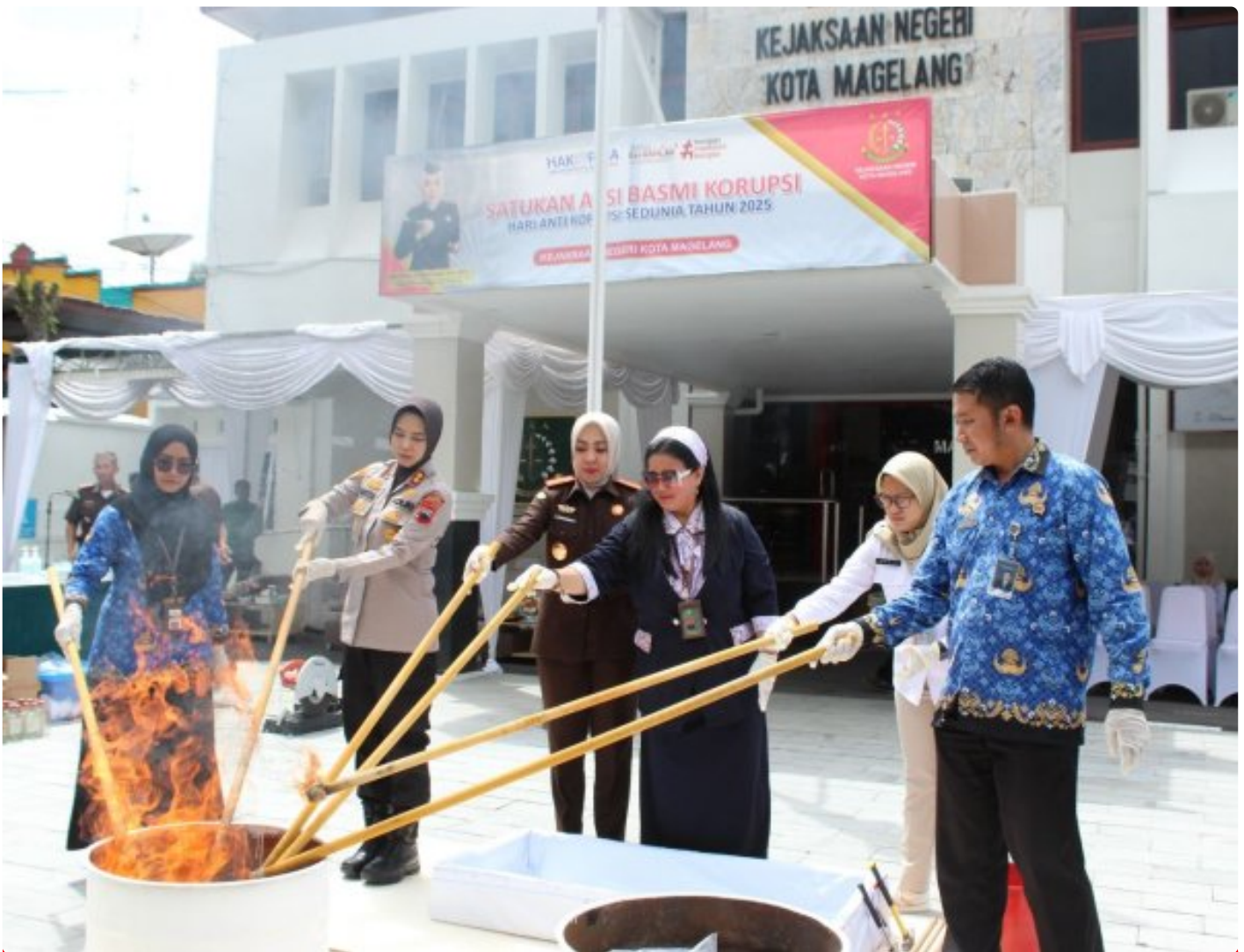
Lapas Magelang Hadiri Pemusnahan Barang Bukti di Kejaksaan Negeri Kota Magelang

Magelang – Lembaga Pemasyarakatan (Lapas) Kelas IIA Magelang menghadiri kegiatan Pemusnahan Barang Bukti Hasil Tindak Pidana yang diselenggarakan oleh Kejaksaan Negeri Kota Magelang pada Rabu (17/12/2025).