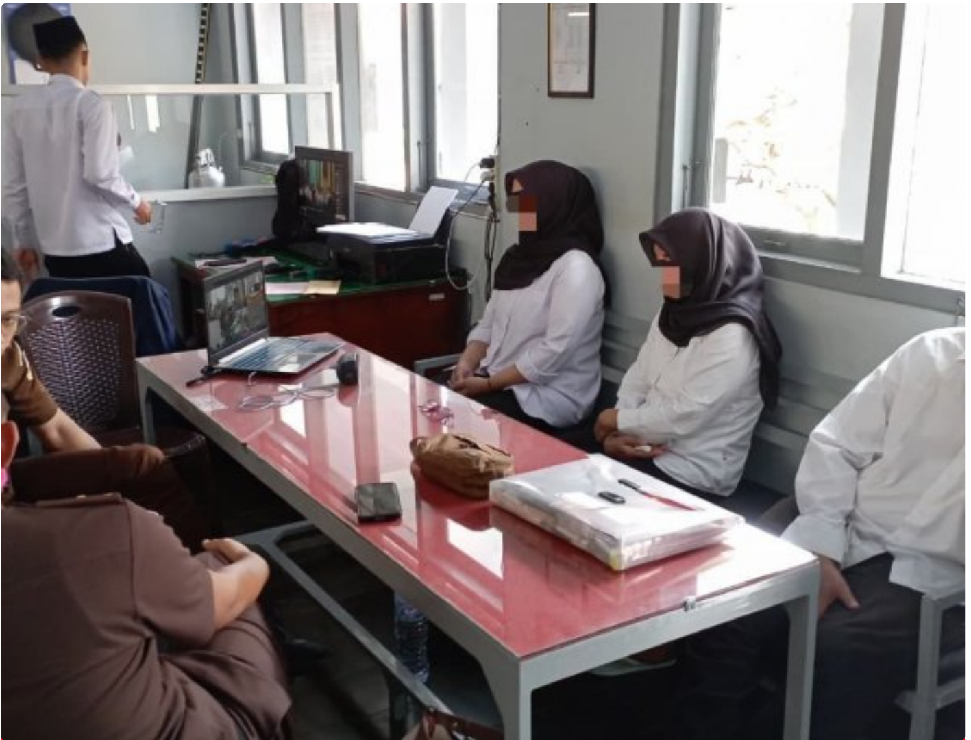
Lapas Magelang Fasilitas pelaksanaan Sidang Daring dengan WBP sebagai Saksi

Magelang – Lembaga Pemasyarakatan (Lapas) Kelas IIA Magelang memfasilitasi pelaksanaan sidang secara daring (online) dalam perkara tindak pidana korupsi (tipikor) dengan menghadirkan Warga Binaan Pemasyarakatan (WBP) sebagai saksi. Kegiatan tersebut dilaksanakan atas permintaan aparat penegak hukum dan bertempat di ruang telekonferensi Lapas Kelas IIA Magelang, Selasa 16/12/2025.