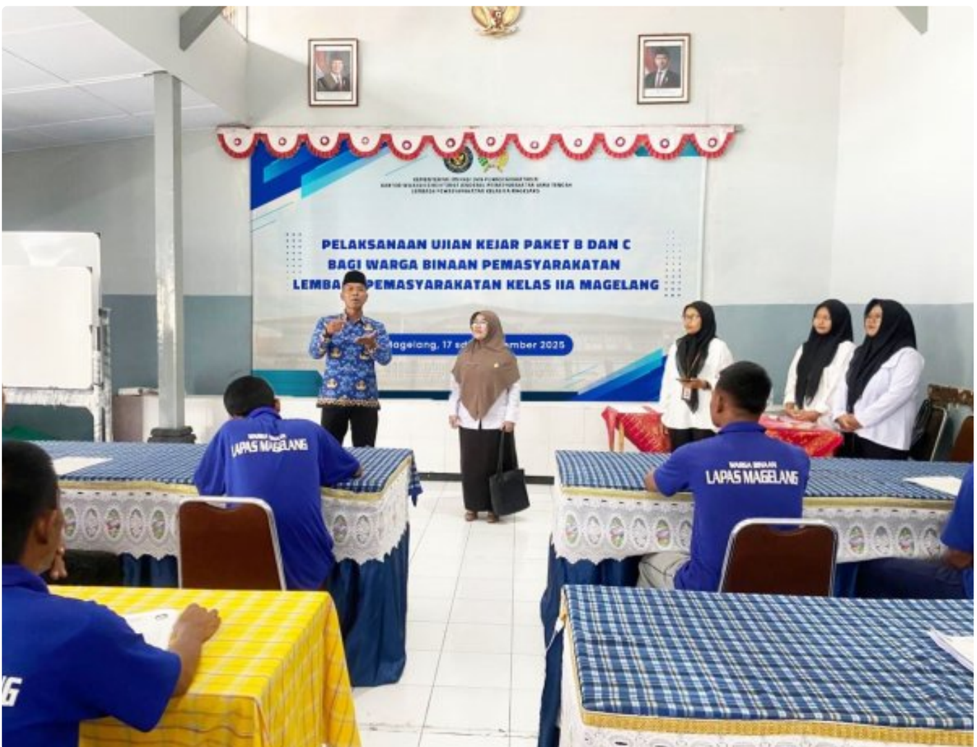
Langkah Awal Menuju Masa Depan, Ujian Kejar Paket B & C bagi Warga Binaan Lapas Magelang

Magelang - Pendidikan menjadi salah satu kunci penting dalam membangun masa depan, tak terkecuali bagi warga binaan pemasyarakatan.