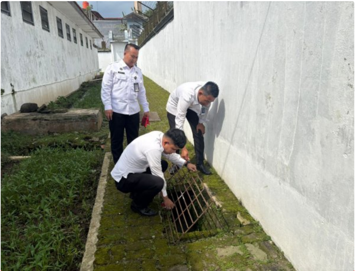
Kesiapsiagaan ditingkatkan, Sie Kamtib Lapas Magelang Intensifkan Deteksi Dini

Magelang - Lapas Kelas IIA Magelang terus menunjukkan komitmennya dalam menjaga stabilitas keamanan dan ketertiban. Melalui Seksi Keamanan dan Tata Tertib (Sie Kamtib), Selasa (02/12/2025). Berbagai langkah penguatan pengawasan kembali diintensifkan, terutama melalui kegiatan deteksi dini yang digelar secara rutin dan terukur.