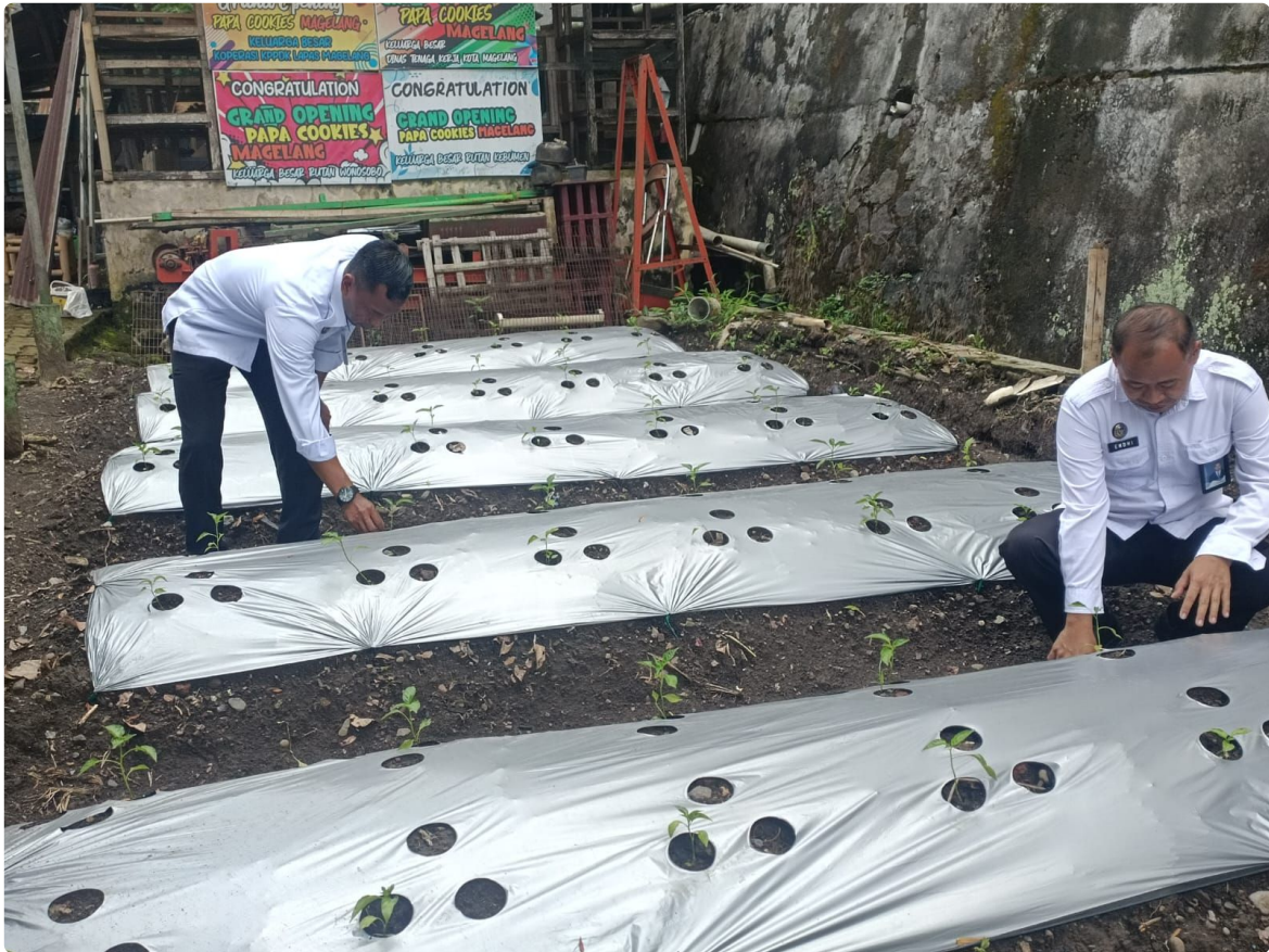
Kegiatan ini merupakan bagian dari implementasi program ketahanan pangan yang dijalankan di lingkungan Lapas Magelang dengan memanfaatkan lahan