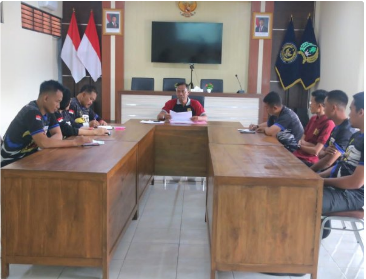
Kalapas Magelang Pimpin Rapat Persiapan Penyediaan Bama Bagi Warga Binaan Tahun 2026

Magelang - Kepala Lembaga Pemasyarakatan (Kalapas) Kelas IIA Magelang memimpin langsung rapat persiapan penyediaan Bahan Makanan (Bama) untuk warga binaan pada tahun anggaran 2026, Sabtu (29/11/2025).