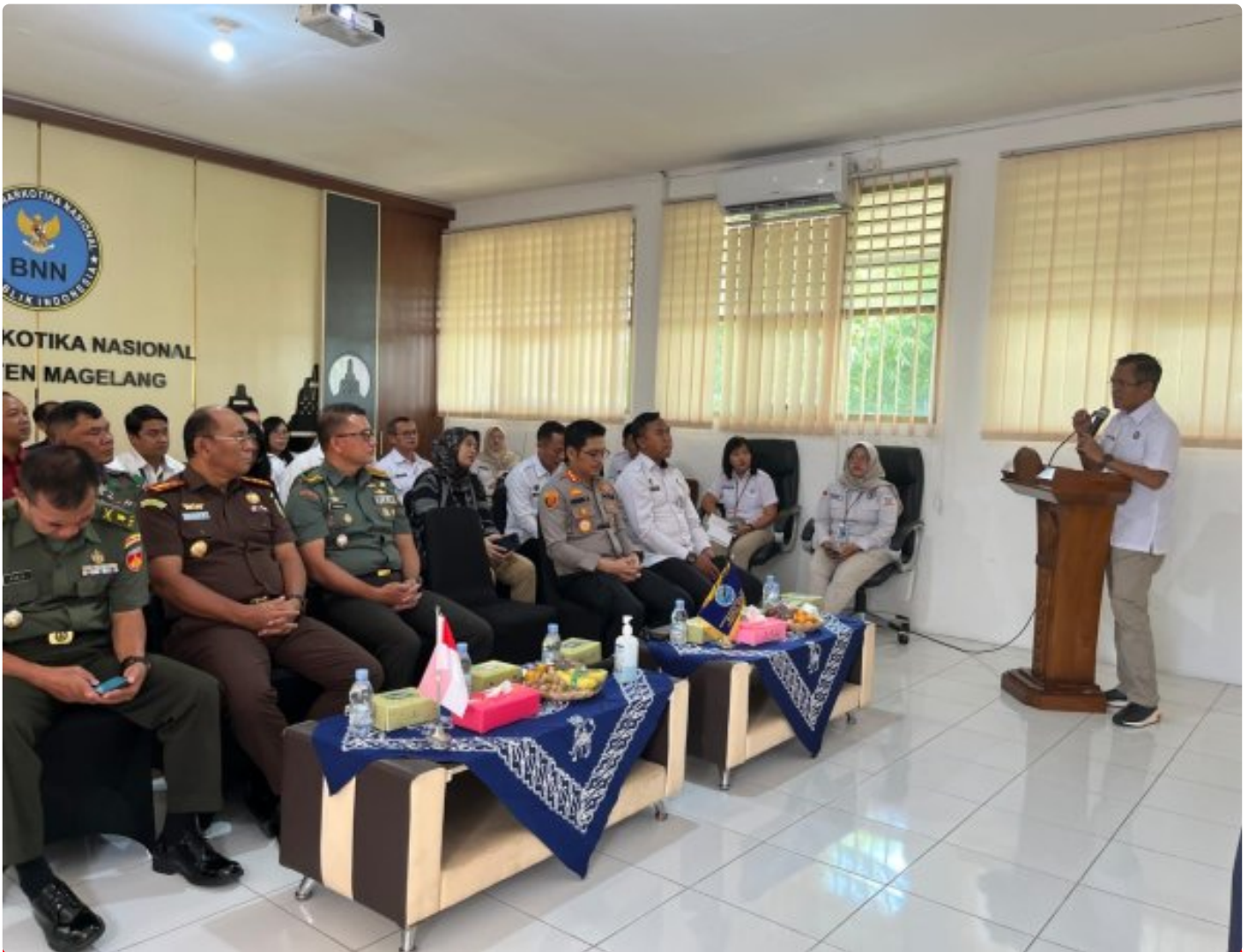
Jalinan Sinergitas Lapas Magelang dengan BNN Kabupaten Magelang

Magelang -- Lembaga Pemasyarakatan Kelas IIA Magelang terus memperkuat komitmen dalam upaya pencegahan dan pemberantasan penyalahgunaan narkotika.