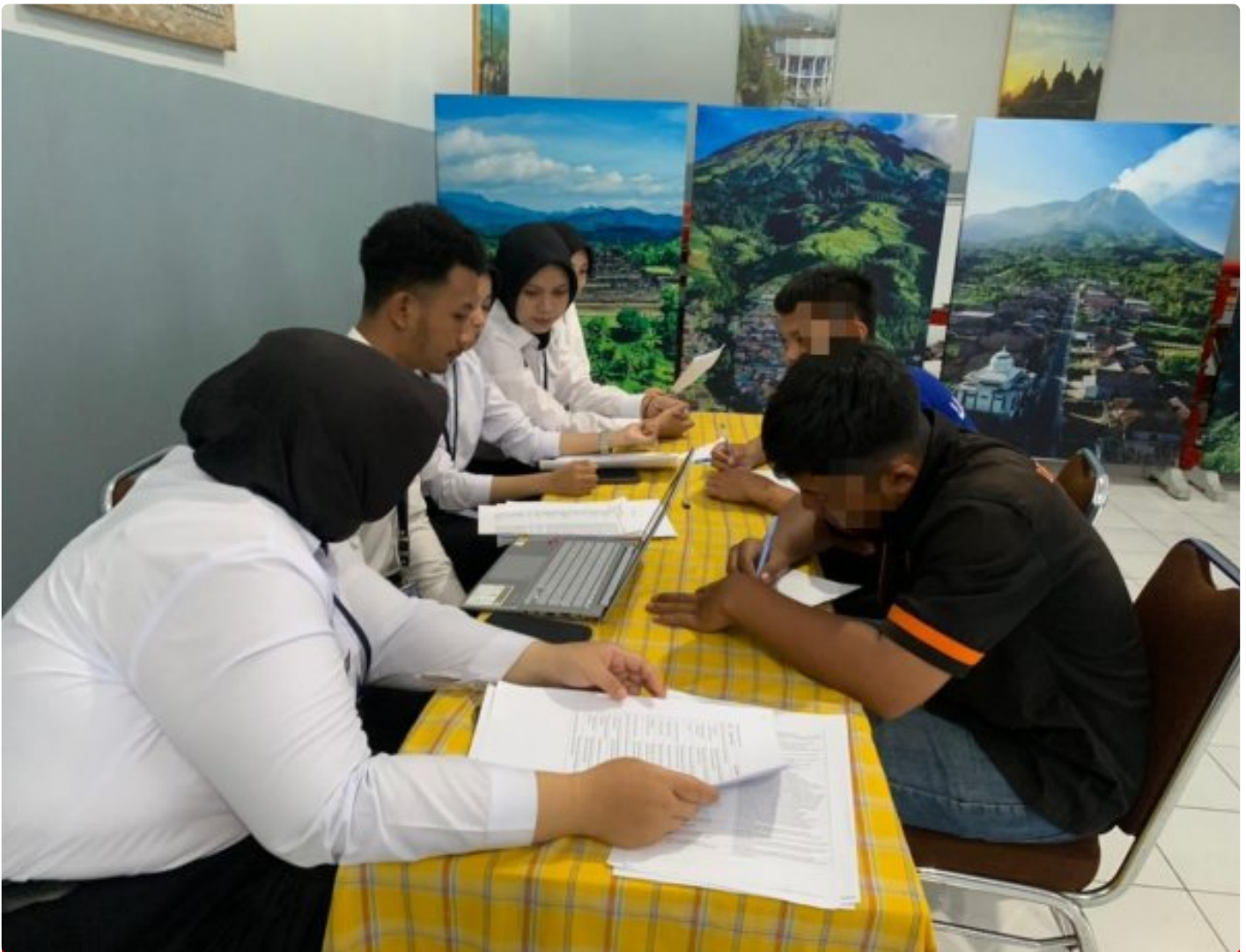
Dukung Hak Pendidikan, Lapas Magelang Data WBP Calon Peserta Program SKB-SPNF

Magelang - Dalam rangka mendukung pemenuhan hak pendidikan bagi Warga Binaan Pemasyarakatan (WBP), Senin 15/12/2025 Lembaga Pemasyarakatan (Lapas) Magelang melaksanakan kegiatan pendataan bagi WBP yang akan mengikuti Program Pendidikan di Sanggar Kegiatan Belajar–Satuan Pendidikan Nonformal (SKB-SPNF) Kota Magelang.