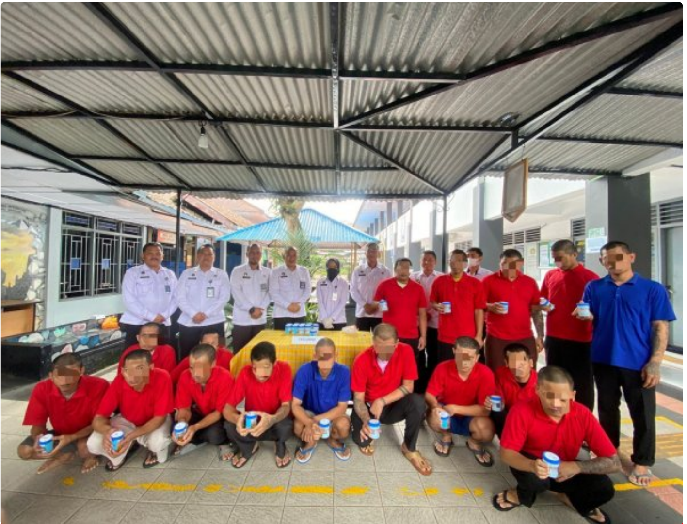
Cegah Peredaran Gelap Narkoba, Lapas Magelang Tes Urin Seluruh WBP

Magelang — Dalam upaya memperkuat pencegahan peredaran gelap narkoba di lingkungan masyarakat, Lembaga Masyarakat (Lapas) Kelas IIA Magelang melaksanakan tes urin kepada seluruh Warga Binaan Masyarakat (WBP), pada Rabu, (03/12/2025).