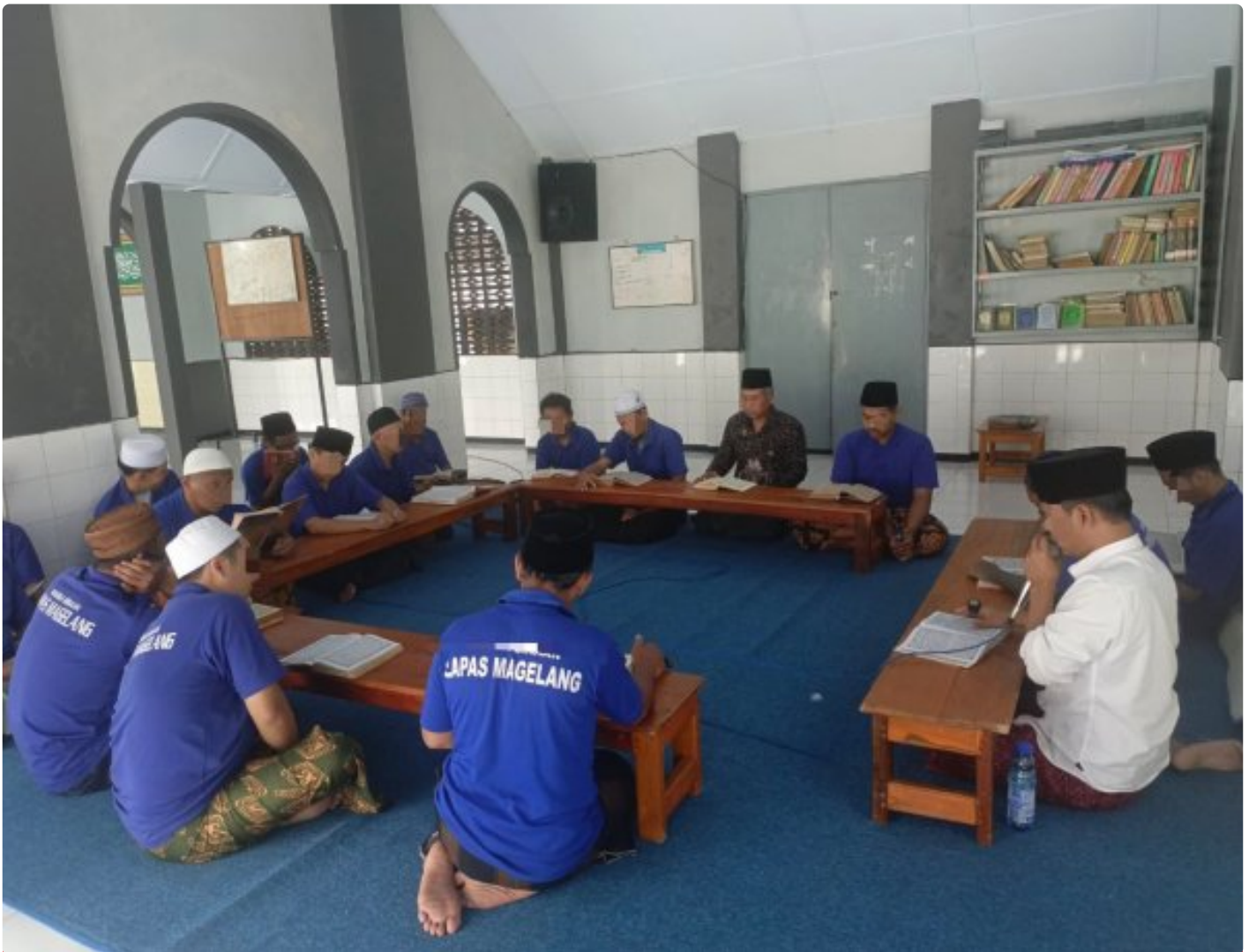
Bangun Akhlak melalui One Day One Juz di Lapas Magelang

Magelang – Kamis, 04/12/2025 Lembaga Pemasyarakatan Kelas IIA Magelang terus meningkatkan program pembinaan kepribadian bagi Warga Binaan Pemasyarakatan (WBP) melalui kegiatan keagamaan, Kamis (04/12/2025).